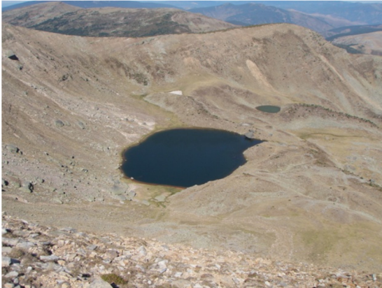
Vista de la laguna desde el pico Urbión. 29/08/2012