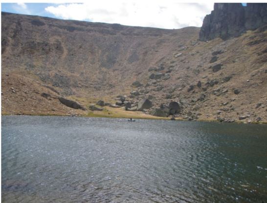
Muestreo en embarcación. 29/08/2012