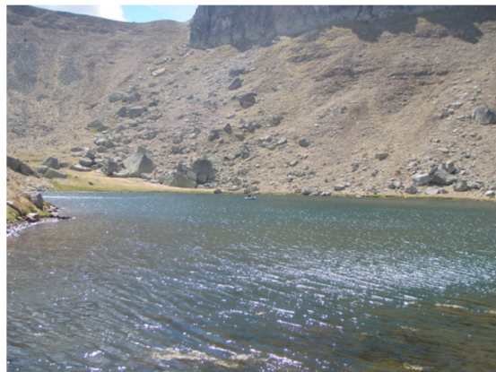
Vista de la laguna desde el litoral.