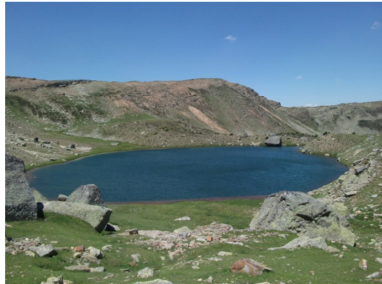
Vista de la laguna desde el litoral. 25/07/2013.