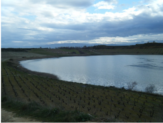
Vista del lago y de los viñedos circundantes en marzo