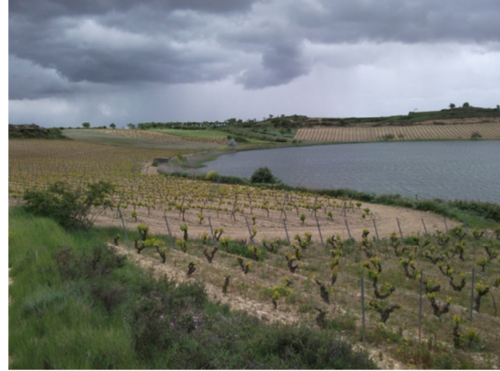
Vista del lago y de los viñedos circundantes en mayo